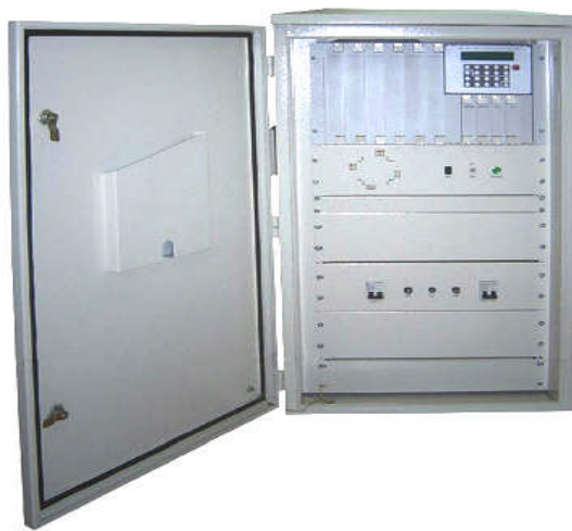
图 1 信号机外形图

路口控制软件、交通信号控制机硬件都追求模块化和通用化，系统内部及与外部的通信（中心与中心、中心与外场、外场与外场之间）都实现通用、规范化。